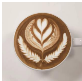
3-tier tulips and 2 rosettas