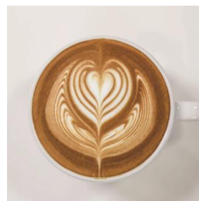
Tulip pushing 5 times