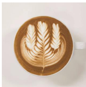
Central Rosetta / Small Rosetta